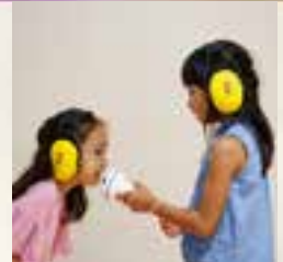
タッチ・ザ・サウンド・ピクニック